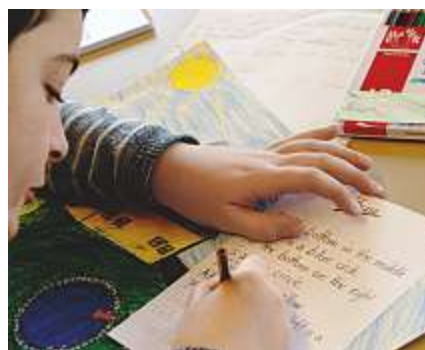
Sprachen lernen mit Passepartout: Ein 5.-Klässler beschreibt ein von ihm gemaltes Bild in Englisch.

Das Volksschulamt hat unter Beteiligung von Expertinnen der PH FHNW Informationsveranstaltungen für Lehrpersonen der beiden Berufsbildungszentren (BBZ)