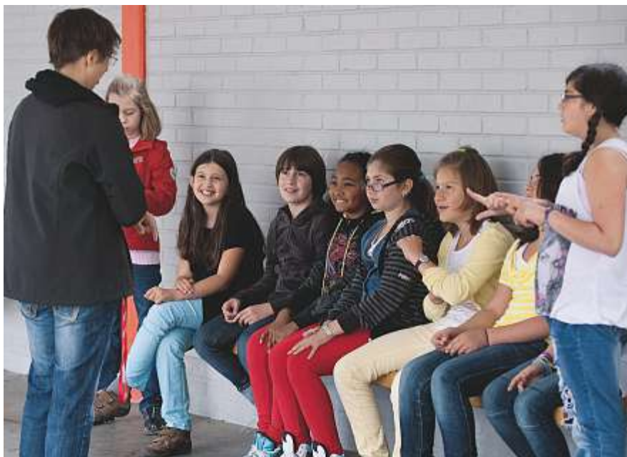
Die SCALA-Studie zeigt Ursachen der Chancenungleichheit und wie sie durch veränderte Erwartungshaltungen der Lehrpersonen abgeschwächt werden können.

Das Team des Projekts SCALA «Bildungschancen in sozial heterogenen Schulklassen fördern» hat 66 Lehrpersonen und circa 1100 Schülerinnen und Schüler des 4. bis 6. Schuljahres sowie deren Eltern aus 6 Deutschschweizer Kantonen befragt. Die Ergebnisse zeigen: Trotz gleich guten Leistungen im SCALA-Leistungstest in den Fächern Mathematik und Deutsch erwarten Lehrpersonen von Kindern mit Migrationshintergrund geringere Leistungen als von Schweizer Kindern. Das Analoge finden wir für den sozioökonomischen Status. Auch in Bezug auf das Geschlecht gibt es einen Unterschied: Trotz gleichem Ergebnis im Leistungstest werden höhere Leistungen von Mädchen im Fach Deutsch erwartet als von Buben. Dies lässt vermuten, dass die Förderung und Beurteilung der Kinder im Unterricht leider oft nicht so fair ausfällt, wie sie eigentlich sollte.