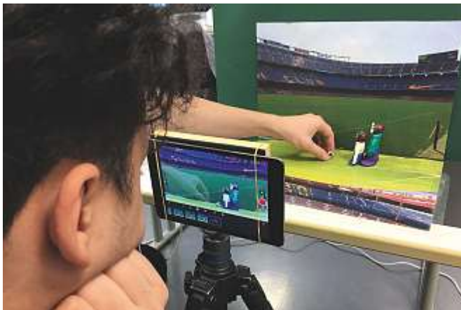
Ein Schüler macht seine Knetfiguren bereit zur Filmaufnahme.

Jahresangebot Workshops (1 bis 5 Tage) unter: www.fantoche.ch/schulen . Fantoche Festival, Baden: 4. bis 9. September mit Schulangebot.