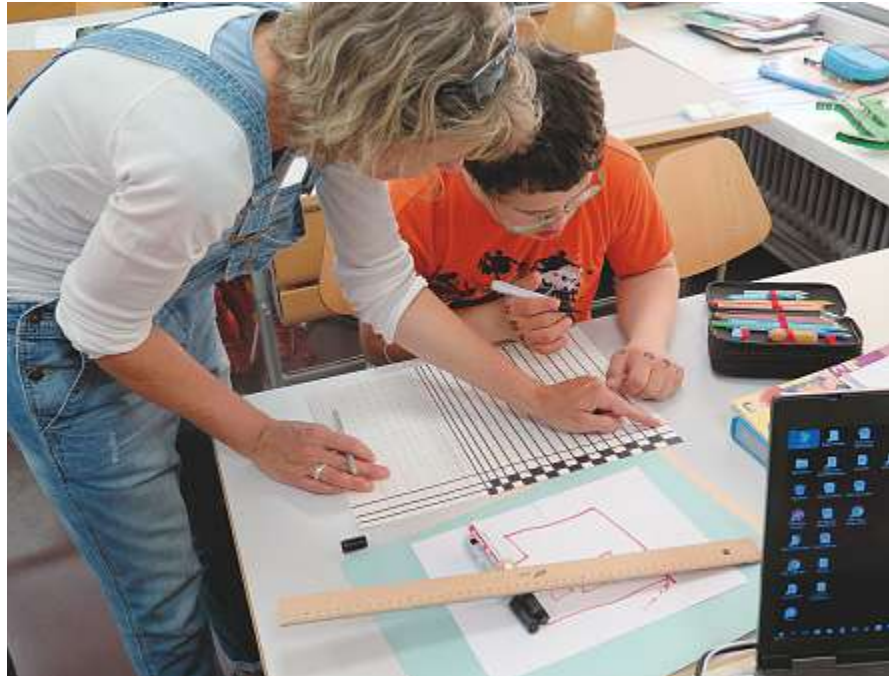
Jedes Kind soll die bestmögliche Unterstützung erhalten.

Neu wird zwischen Regelschule und kantonalen Spezialangeboten unterschieden. Die Einwohnergemeinden sind für die Regelschule und die Spezielle Förderung zuständig, der Kanton für jene Angebote, die darüber hinausgehen. Das heisst, Volksschulangebote, welche nicht ins ordentliche Regelschulangebot fallen, sind kantonale Spezialangebote, die Kosten trägt der Kanton. Mit der Entflechtung werden die Zuständigkeiten geklärt und Abläufe vereinfacht.