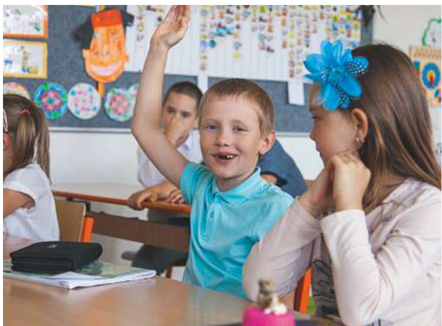
Die Primarschule gehört neben Kindergarten und Sekundarschule zur Regelschule.

Um eine grössere Flexibilität in der Umsetzung der Speziellen Förderung zu erreichen wird der Lektionenpool für schulische Heilpädagogik auf der Primarstufe von 20 bis 27 Lektionen pro 100 Schülerinnen und Schüler auf neu 20 bis 28 Lektionen erhöht.