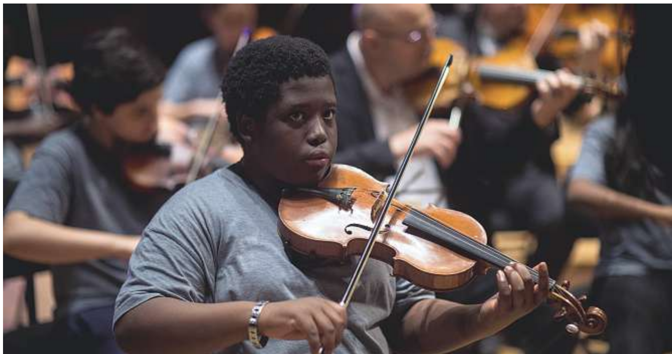
Arnold bekommt nach intensivem Üben den Solo-Part.