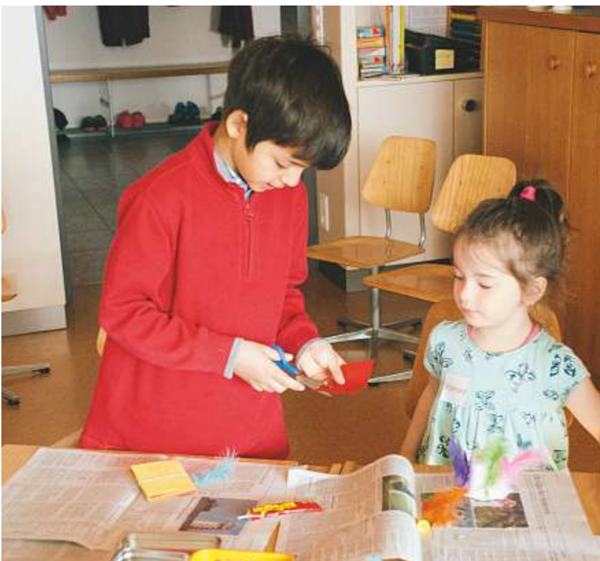
SOLE Schulen nutzen verschiedene Situationen, um soziales Lernen zu ermöglichen.

Mehr zum Programm SOLE unter www.fhnw.ch/wbph-sole