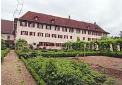
Ansicht des Klosters Dornach vom Garten her.

Tram, kulturelle und geschichtliche Einrichtungen wie das Neue Theater, das Kloster, das Goetheanum und das Schloss Dorneck, weitherum bekannt durch die Schlacht von 1499.