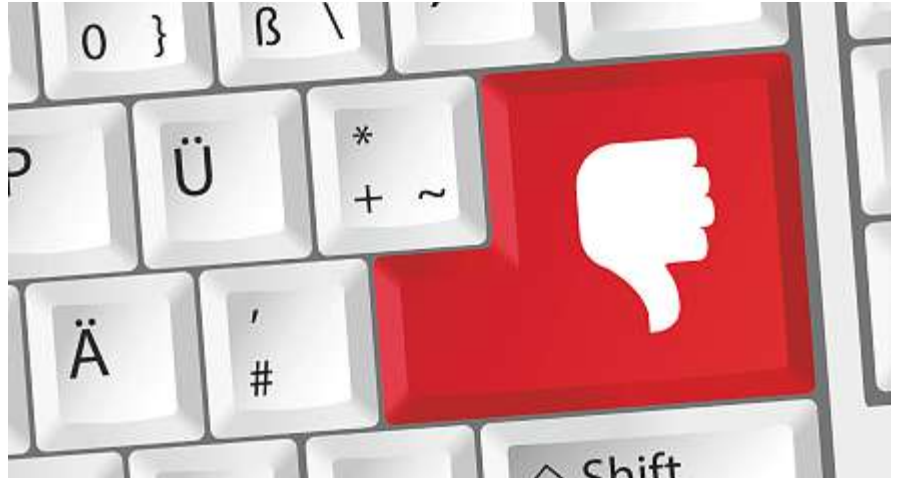
Eine Befragung zeigt: Die Motivation der Mitarbeitenden der kantonalen Verwaltung hat gelitten.

sonen geht die GL dabei kaum falsch in der Annahme, dass die Resultate einer solchen Umfrage in den Schulen mindestens so schlecht ausfallen würden wie bei den Angestellten der Verwaltung.