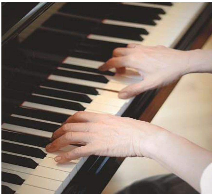
Qualität im Instrumentalunterricht ist nicht ohne gute Anstellungsbedingungen zu haben.