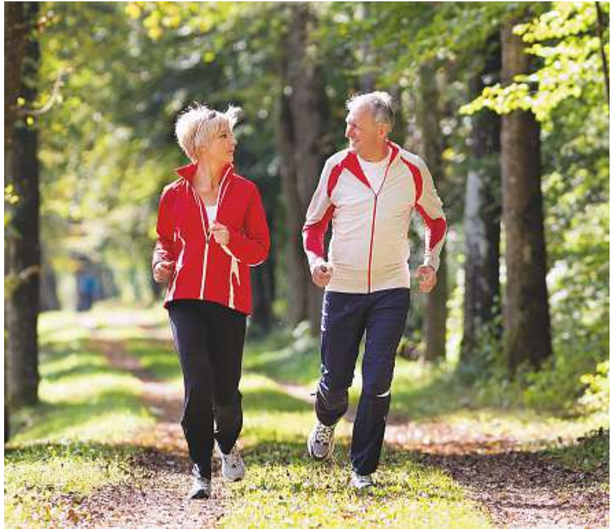
Pensioniert? Viele Möglichkeiten für Interessen und Aktivitäten sind da.