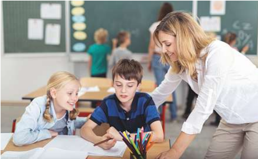
Ändert sich Ihr Arbeitspensum auf das neue Schuljahr?

alv-Mitgliedschaft. Das Sekretariat des alv erfasst noch vor den Sommerferien alle Pensenänderungen auf das neue Schuljahr 2018/19. Alle betroffenen Mitglieder des Aargauischen Lehrerinnen- und Lehrerverbands sind gebeten, sich zu melden.