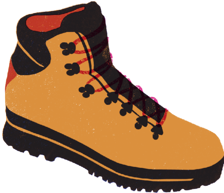
Illustration: Laura Jurt

Die Berufsmaturität vermittelt eine erweiterte Allgemeinbildung. Sie führt die Lernenden zur Studierfähigkeit an einer Fachhochschule sowie zu geistiger Offenheit, persönlicher Reife und zu einem ganzheitlich-vernetzten Denken.