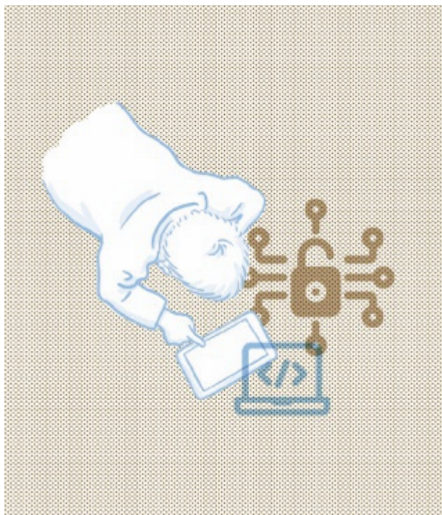
Illustration: Beatrice Kaufmann

MINT wird für viele Lehrpersonen interessant und greifbar, wenn es mit konkreten Personen und mit aktuellen Themen verbunden ist. Durch den Kontakt mit realen Menschen, die im Bereich MINT forschen und arbeiten, lernen angehende oder bereits berufstätige Lehrpersonen neue Facetten und Möglichkeiten der MINT-Fächer kennen. Und dadurch entsteht oder wächst vielleicht hie und da das Interesse an MINT.